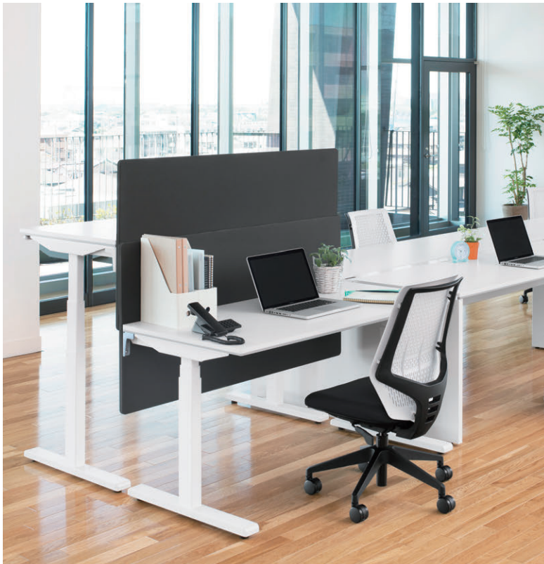
セット写真のテーブル FNL-D147HWW、チェア YC-200NW-K